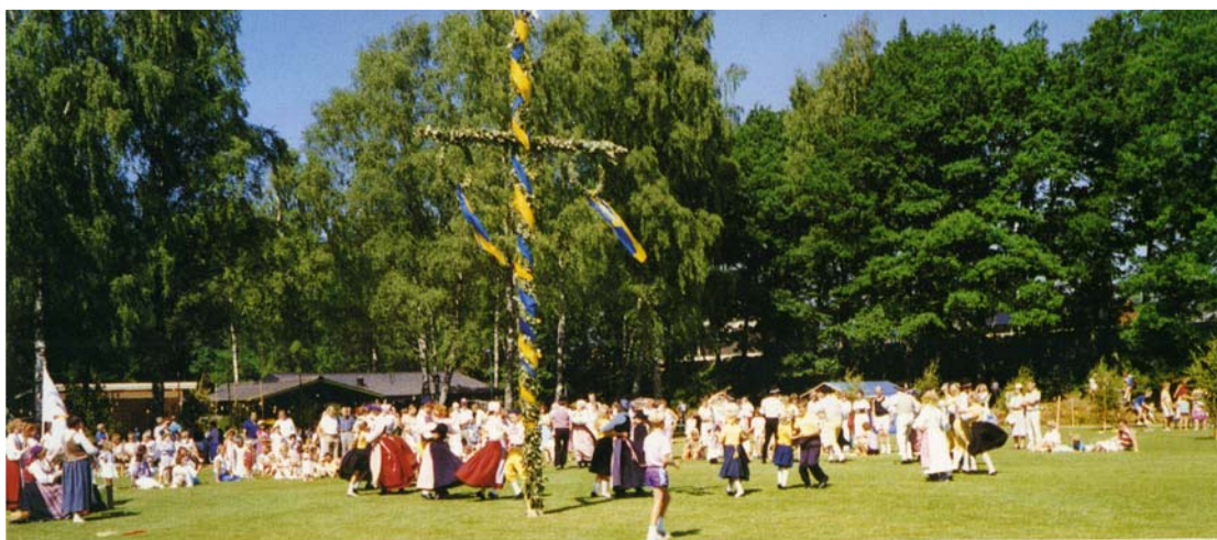
Midsommar på Sjövallen 1987