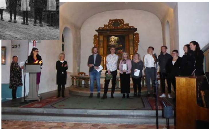
Stipendieutdelning i Örskelljunga kyrka 2017

Den del av donationen som disponeras av utbildningsnämnden ska enligt nuvarande reglemente användas som bidrag för allmänskulturell verksamhet och som stipendier till personer för eftergymnasial utbildning, som ej kan erbjudas på hemorten (förutsätter boende på annan ort) Den årliga utdelningen sker vid en högtid i början på november i Örskelljunga kyrka. År 2017 fick 28 stipendiater 24.000:- vardera och 13 föreningar fick dela på 128.000:- för allmänskulturell verksamhet. I Örskelljungabygden hör man ibland talas om "Lilla nobelpriset"!