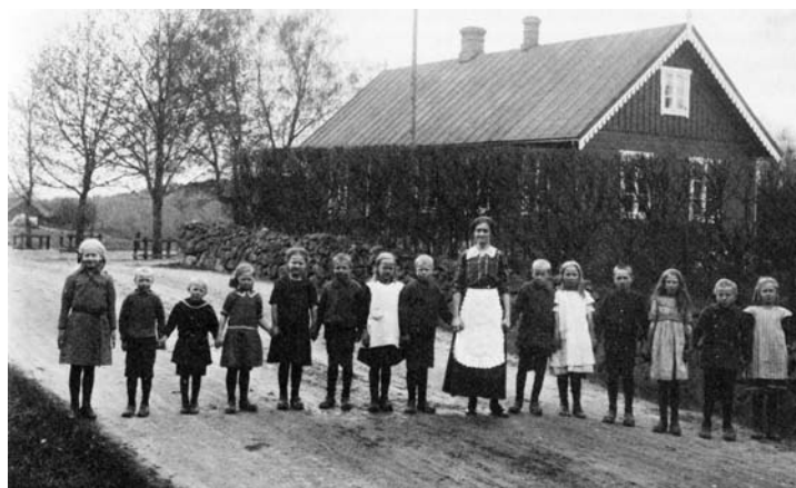
Småskolan i Lärkesholm

Redan 1793, 49 år före den första folkskolestadgan i vårt land, kom den första skolan igång på Lärkesholm. Den var inrymd på Lärka gård och tog emot barn från hela Örskelljunga församling. Från 1807 till 1840 var skolan i den s.k. arbetsinrättningen. I en förteckning från 1840-talet anges att skolan undervisade 102 barn. En ny skola byggdes i V. Spång 1840, men läget stämde inte med testatorns önskemål, d.v.s. att skolorna skulle ligga vid Lärkesholm. Därför byggdes en helt ny folkskola 1870 nära godset och fem år senare en småskola. Dessa skolor var i bruk till 1959, då von Reisers skola i Åsljunga stod färdig.