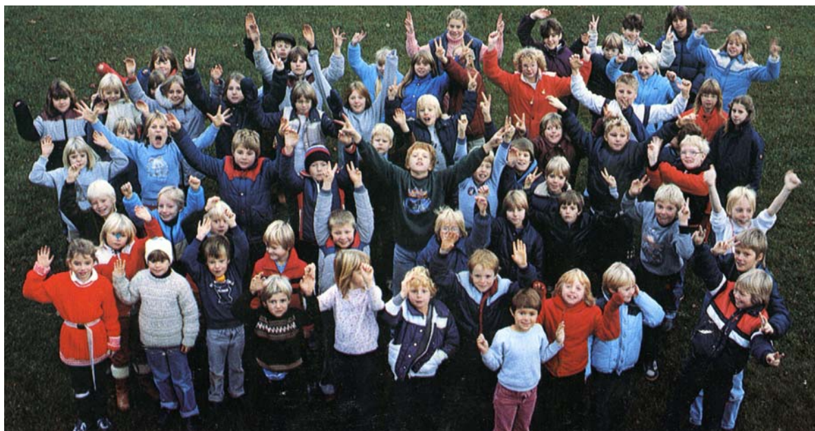
Ungdomar i Åsljunga 1983