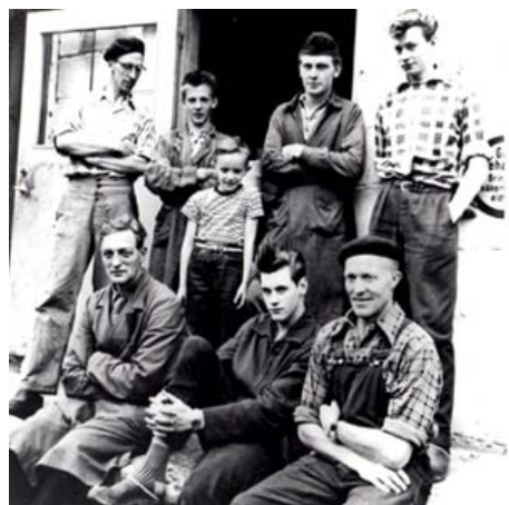
Personalen på Konstruktions-Bakelit 1958.

Lokalerna utökades successivt och 1971 byggdes en helt ny fabrik i Örkelljunga. AB Konstruktions-Bakelit, numera omdöpt till KB Components, såldes år 2009 till BRA Invest, och är idag leverantörer till stora delar av världens bilindustri. Företaget har dotterbolag i Litauen, Mexico och Kina.