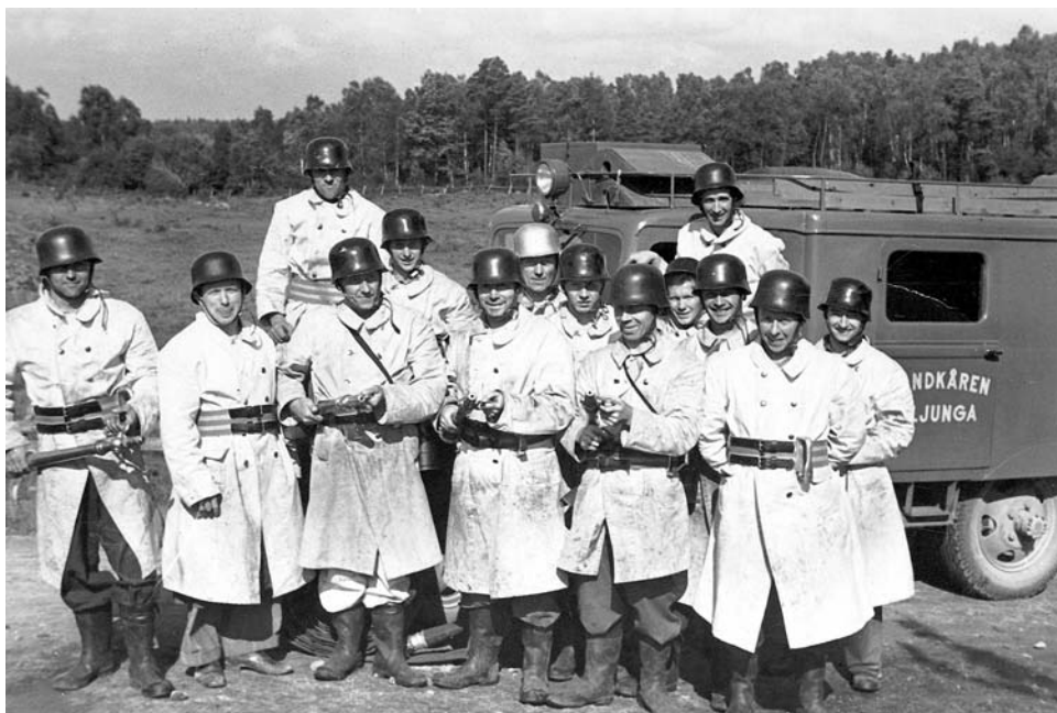
På fotot ser vi en stolt Brandkår 1950